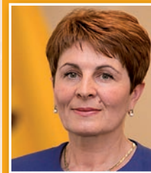
Valentina Țapiș, Secretar de Stat în domeniul mediului, MADRM

Implementarea legii va avea un efect pozitiv asupra mediului, componentelor acestuia și ecosistemelor, ținând cont de faptul că legea în primul rând este destinată pentru stabilirea măsurilor necesare în scopul protecției mediului și a sănătății populației prin prevenirea sau reducerea efectelor adverse generate de producerea și gestionarea deșeurilor, inclusiv celor periculoase. Concomitent implementarea legii va contribui la executarea angajamentelor internaționale asumate de către Republica Moldova în urma ratificării tratatelor internaționale de mediu, ceea ce va fi benefic pentru dezvoltarea durabilă la nivel național, regional și internațional.